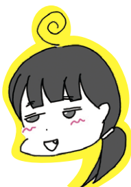
スタッフ 川本 好きなお菓子はグミ