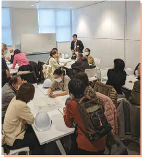
とよはくパートナー活動の様子

博物館学習グループが行う「アクティブ・ラーニング・ツアー」は、豊田市博物館ならではの取組の一つです。小中学校の各学年に応じた学習プログラムモデルをもとに、学校と一緒に学習活動を考えて実施します。例えば博物館の展示を見て、さらに実際に史跡などに足を運ぶ、という流れで学習を深めていく活動をイメージしています。市内の小学6年生と中学2年生が、この学習に参加します。