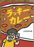
安澄さんの好きな本 『ラッキーカレー』 シゲタサヤカ / 作 小学館 請求記号 E/シゲ /