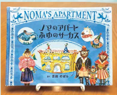
受賞時の作品 『ノマのアパート ふゆのサーカス』

出版にあたって担当編集者さんと相談を重ねて、意見をいただきながら、今の形へとブラッシュアップさせていきました。まず、アパートとサーカスの2つの要素があっ