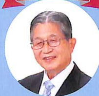
ふじしま あきら 藤嶋 昭氏

目的をもって調べることは 大変ですが、分かってくると楽しく なりますね。そしてますます深く知 りたくなり、ほかの人にも伝えたく なるものです。